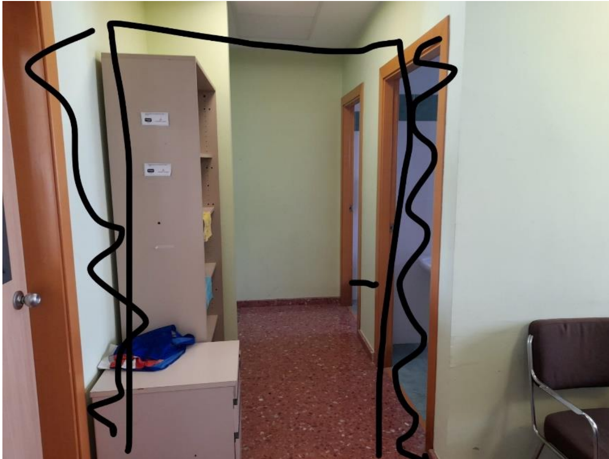
Ubicación del tabiquillo con puerta o cancela, necesario en ambas propuestas.